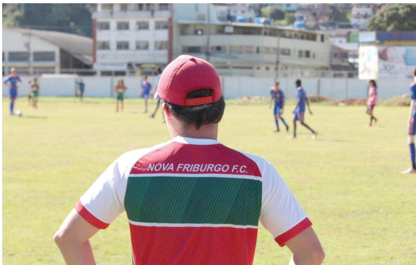
Clube mantém as atividades de escolinha, futebol de base, feminino e futebol de mesa, dentre outras

Uma história que merece ser comemorada a cada ano, seja recordando os inúmeros capítulos gloriosos ou projetando o futuro cada vez mais real. O Nova Friburgo Futebol Clube completa 41 anos nesta quarta-feira, 16, e em tempos “normais”, uma grande celebração seria promovida pela instituição. Contudo, em tempos de pandemia, as comemorações serão feitas através das redes sociais.