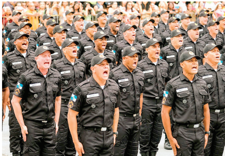
Os novos integrantes da tropa foram empossados em cerimônia no Rio de Janeiro com a presença do governador Cláudio Castro