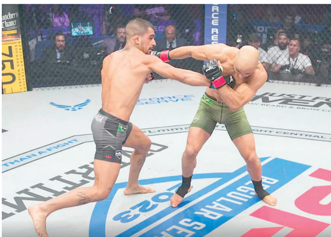
Marlon Moraes encerra, de vez, a carreira como lutador de MMA