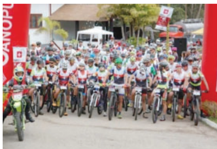
Centenas de competidores e amantes da bike são aguardados no Route MTB deste ano

Apesar de amador, o bolão exige dedicação profissional. Os atletas utilizam outras modalidades, como caminhada, natação e corrida, para manter a forma e desenvolver resistência. O desgaste durante o campeonato é grande: os jogadores chegam a arremessar 40 bolas em competições nacionais, divididas em dez jogadas por cada pista. No mundial, são 120 arremessos por atleta, sendo cinco de aquecimento por pista (totalizando 140 bolas).