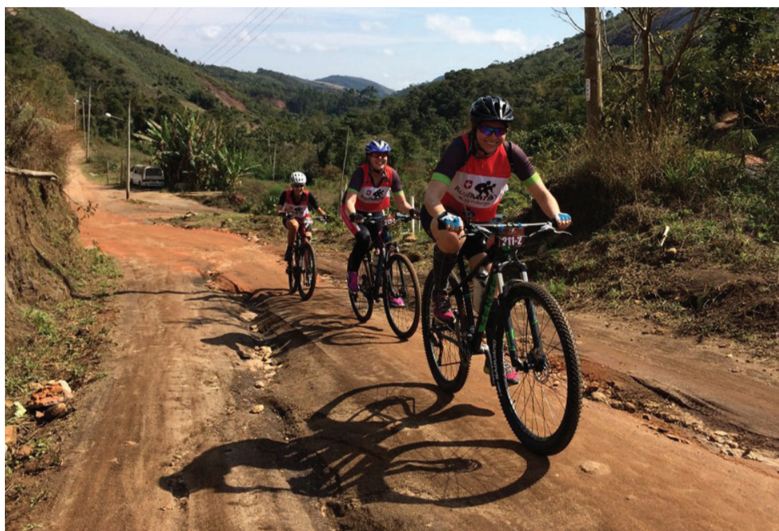
Prova de ciclismo contempla percursos em meio à natureza, relembrando o caminho dos colonos