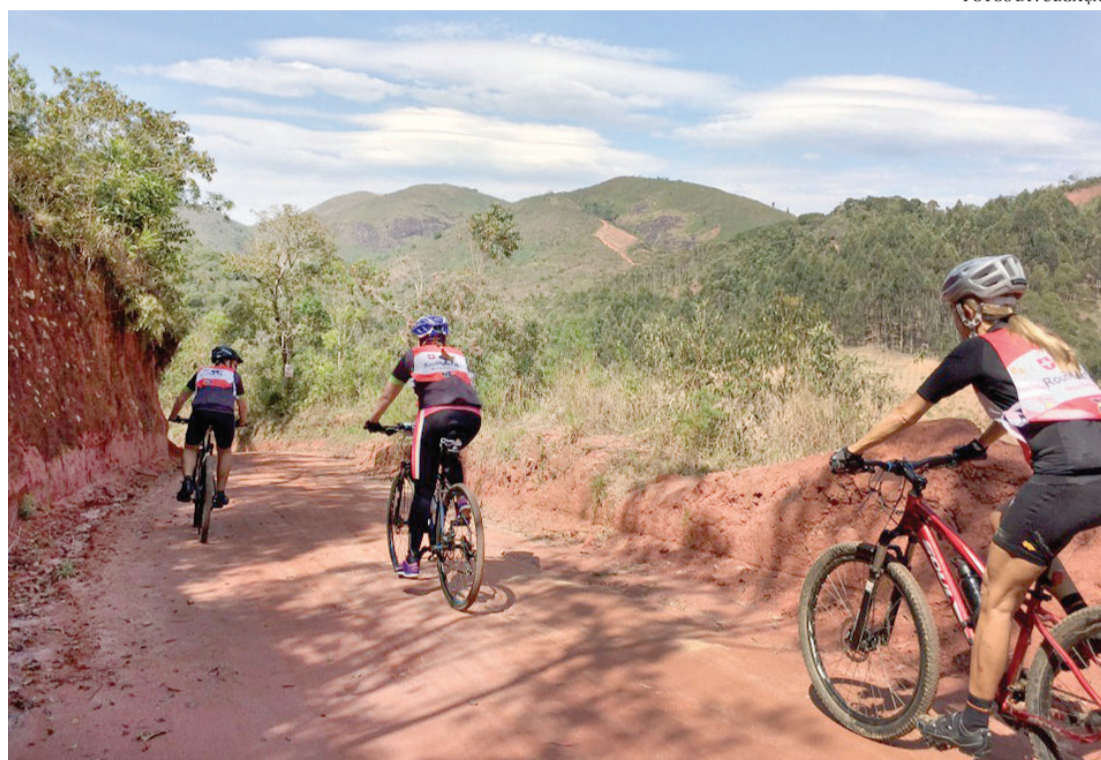
Ciclistas vão passar por estradas dos municípios de Nova Friburgo e Sumidouro

O esporte também faz parte da história de Nova Friburgo e a maioria das modalidades foi trazida pelos colonos. Nada mais justo, então, do que inserir o contexto esportivo nas comemorações pelo Agosto Suíço, englobando atividades durante todo este oitavo mês do ano. Dois eventos vão acontecer neste fim de semana, promovendo movimentar também um pouco das partes turística e cultural da cidade.