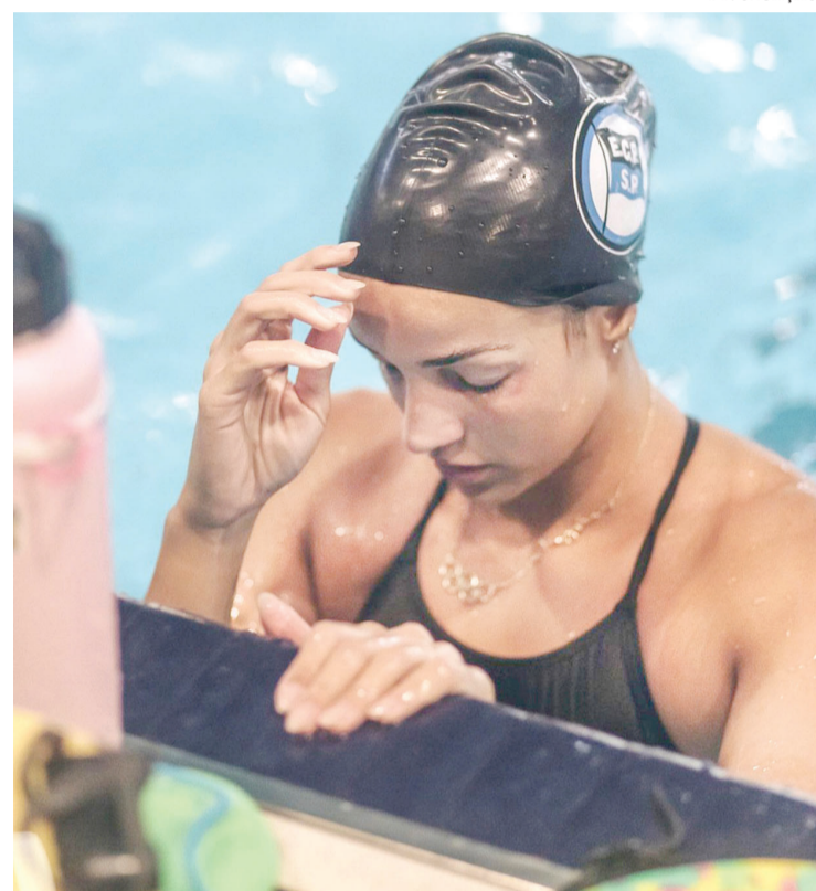
Atleta friburguense vem se consolidando como um dos grandes expoentes nos 50 metros peito

Outra atração é a maior disputa e rivalidade da natação brasileira que volta em grande