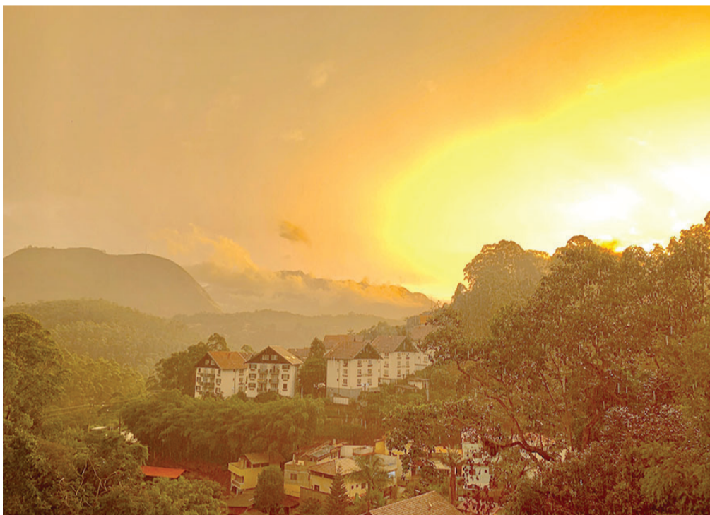
Saudade do sol em Nova Friburgo, né? Pois a previsão do tempo indica que ele seguirá sem aparecer na próxima semana que será de céu nublado, trovoadas e chuva. No entanto, as temperaturas seguirão subindo, chegando próximo aos 30 graus. Será?

"As tatuagens de nomes que carregamos abandonados não pesam. Tatuagem não pesa, tanto quanto não se gramatura cicatriz". Trecho da crônica que será publicada na íntegra na edição deste fim de semana do Caderno Z, o suplemento semanal de A VOZ DA SERRA.