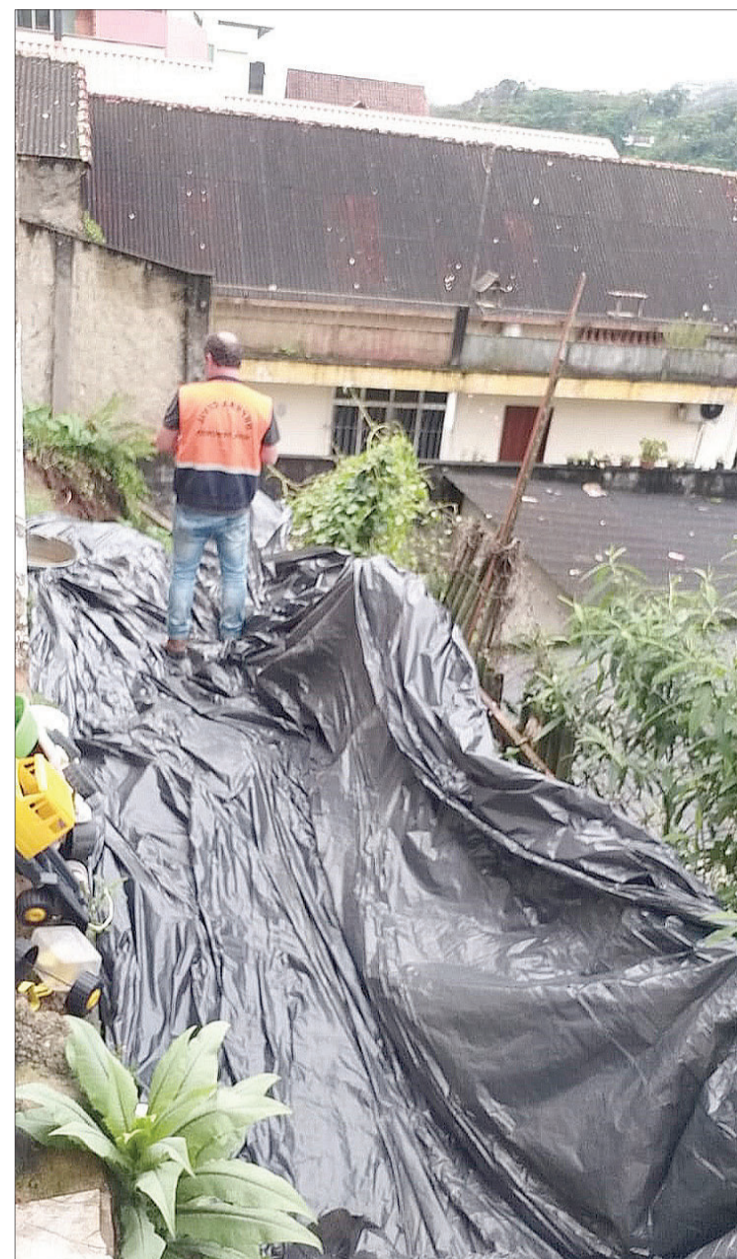
Rua Goiás, bairro Bela Vista

tas, via SMS, da Defesa Civil e orientações sobre como proceder nas situações de emergência, os moradores de todo o estado do Rio podem enviar uma mensagem de texto para o número 40199 com o número de seu CEP, cadastrando assim, o endereço do solicitante. Cabe destacar que só vale enviar um CEP por vez. Em caso de emergência, ligue 199.