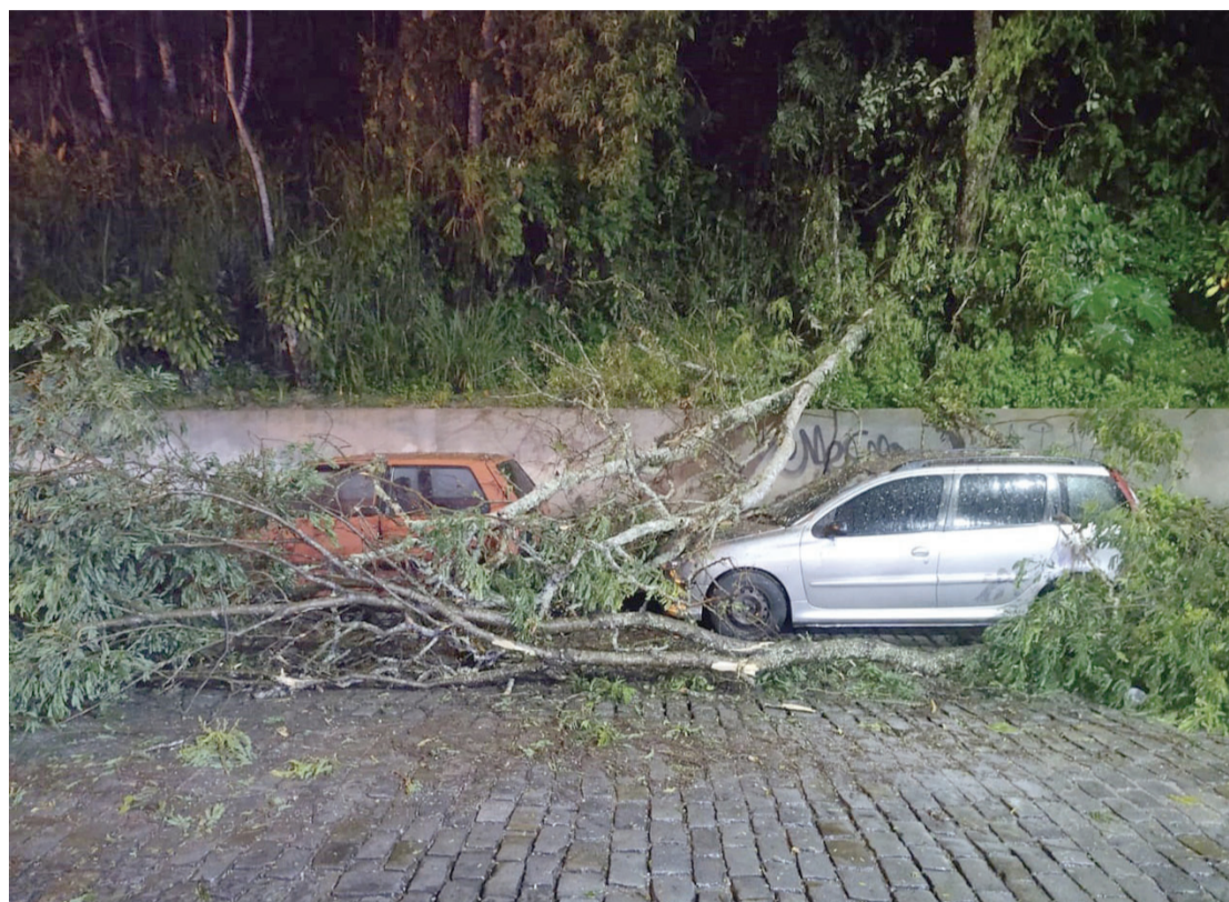
Rua Souza Cardoso, altura do bairro Vila Amélia

Só no último fim de semana, Defesa Civil foi acionada 19 vezes. Não foram registradas ocorrências graves