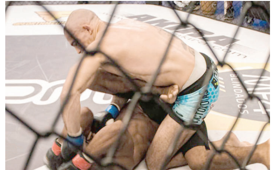
Em seu último compromisso, friburguense venceu a luta por outra organização

primeira vez em abril de 2000. As Regras Unificadas de Artes Marciais Mistas foram adotadas por todas as comissões atléticas estaduais que realizam eventos de artes marciais mistas nos Estados Unidos.