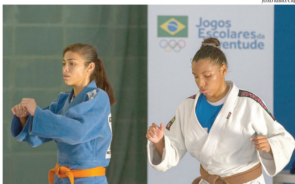
Jogos aconteceriam no mês de dezembro, no estado de Sergipe

chamada de Jogos Olímpicos da Juventude. Grandes nomes do esporte brasileiro passaram pelos antigos Jogos Escolares da Juventude, como a campeã olímpica Sarah Menezes e a campeã mundial Mayra Aguiar, ambas do judô, Hugo Calderano (tênis de mesa), Raulzinho (basquete), Ana Claudia Lemos (atletismo), Etienne Medeiros e Leonardo de Deus (natação).