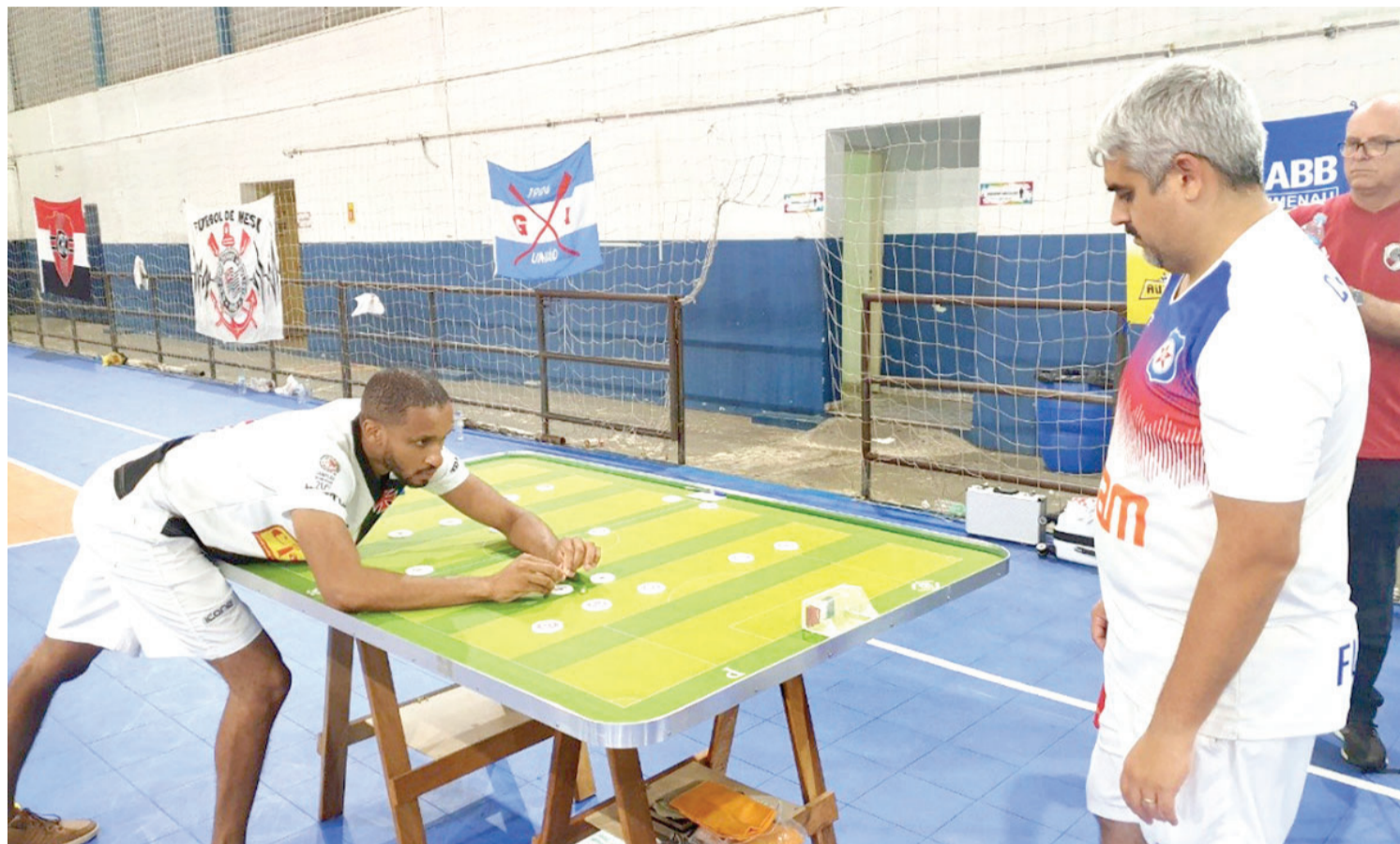
AFFM / Friburguense é uma das participantes da Copa Suderj de Futmesa