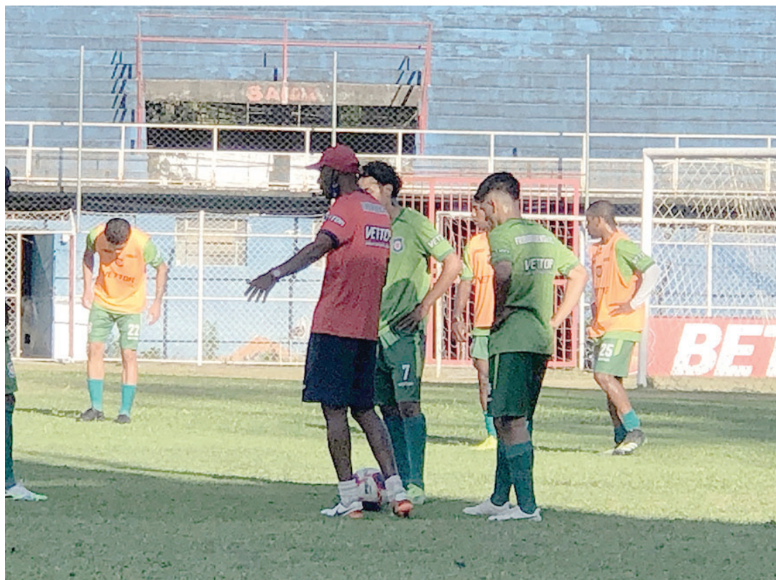
Em compasso de espera, Friburguense se prepara para a estreia na Taça Corcovado

A final da Taça Santos Dumont vai acontecer. O duelo entre Americano e Artsul na tarde desta quarta-feira, 14, às 15h, em Cardoso Moreira, vai definir o campeão do primeiro turno do Campeonato Carioca da Série A2. Provavelmente com volta olímpica, taça e festa. Mas sem a garantia de que a história a ser escrita no Ferreirão será, de fato, aquela a ser contada.