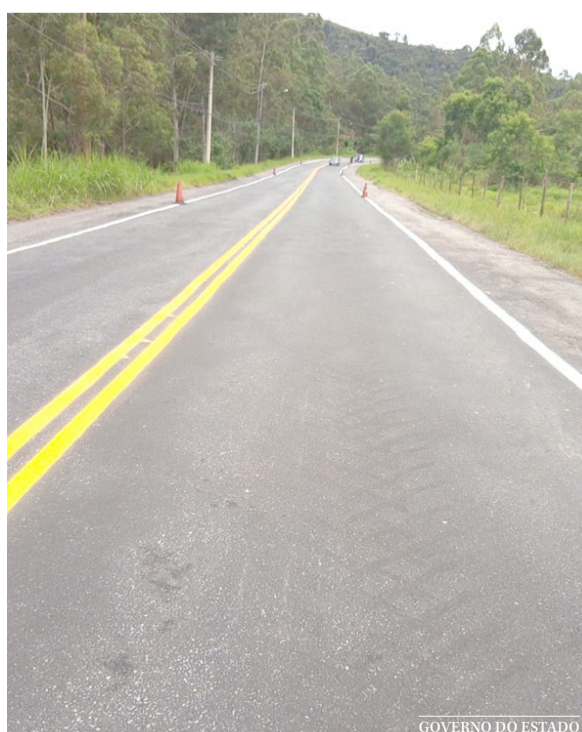
GOVERNO DO ESTADO

O departamento informou que seguirá, ao longo de 2021, intensificando as ações de manutenção e implementação da sinalização, tanto vertical, quanto horizontal, ao longo das 112 rodovias estaduais do Rio de Janeiro. Além de Nova Friburgo, foram recuperados trechos da malha rodoviária em Cordeiro, Petrópolis, Cachoeiras de Macacu, Teresópolis, Sumidouro e Cantagalo.