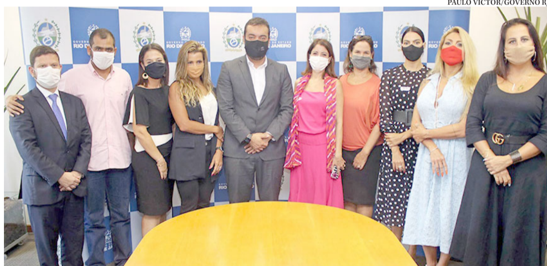
O governador em exercício Cláudio Castro (ao centro) reuniu-se com o novo grupo de trabalho

GRUPO DE TRABALHO INTEGRANDO VÁRIOS ÓRGÃOS DO ESTADO COM A JUSTIÇA VAI ELABORAR NOVAS POLÍTICAS PÚBLICAS