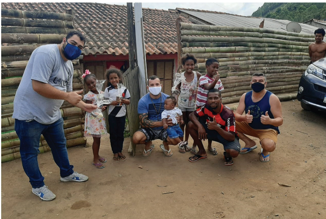
Leite, biscoito, chocolates e outros mantimentos fizeram a Páscoa da comunidade mais doce