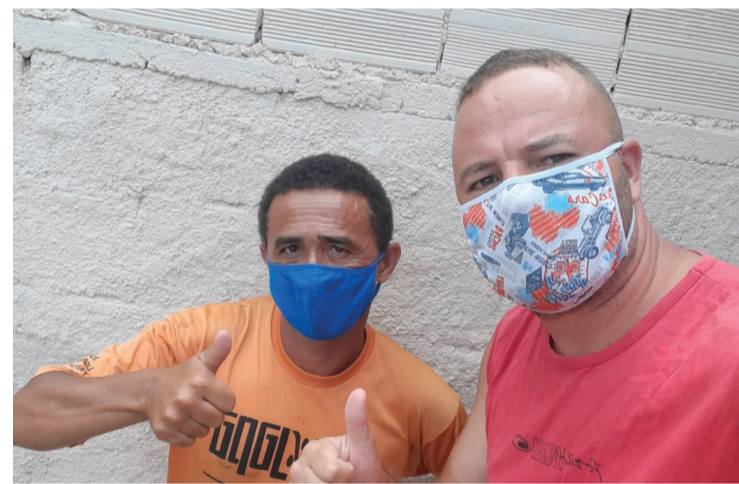
Ação contou com a participação de apoiadores da campanha Páscoa Solidária

tocar o projeto. Além de materiais esportivos, sempre carrega consigo um pequeno aparelho de som e um microfone e, desta forma, compartilha ensinamentos com as crianças, seja em forma de oração ou palestras.