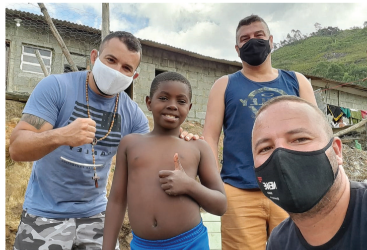
Entrega dos kits foi realizada na manhã do último sábado na Granja Spinelli