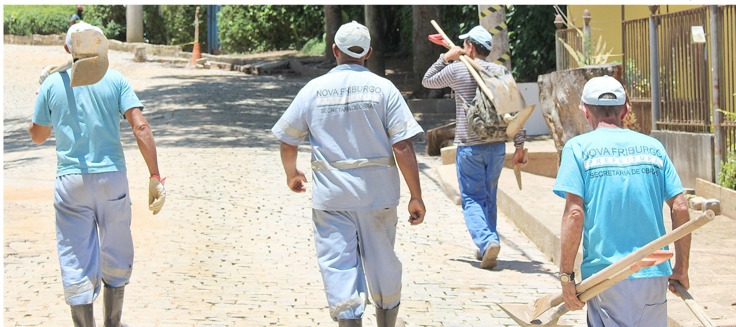
As fortes chuvas do início deste mês causaram vários estragos em Amparo. Obras de reparo estão em andamento

A Prefeitura de Nova Friburgo programou para esta semana o início das obras para consertar os estragos das fortes chuvas do início deste mês no distrito de Amparo. Na Rua Francisco Marcelo Gripp o calçamento que foi danificado pela enxurrada começou a ser refeito ainda na segunda-feira, 20. Primeiramente, equipes da Secretaria Municipal de Obras realizaram a desobstrução de uma pequena rede de água pluviais e também a limpeza dos bueiros, auxiliando no escoamento da água. Após esta preparação, o calçamento começou a ser recolocado.