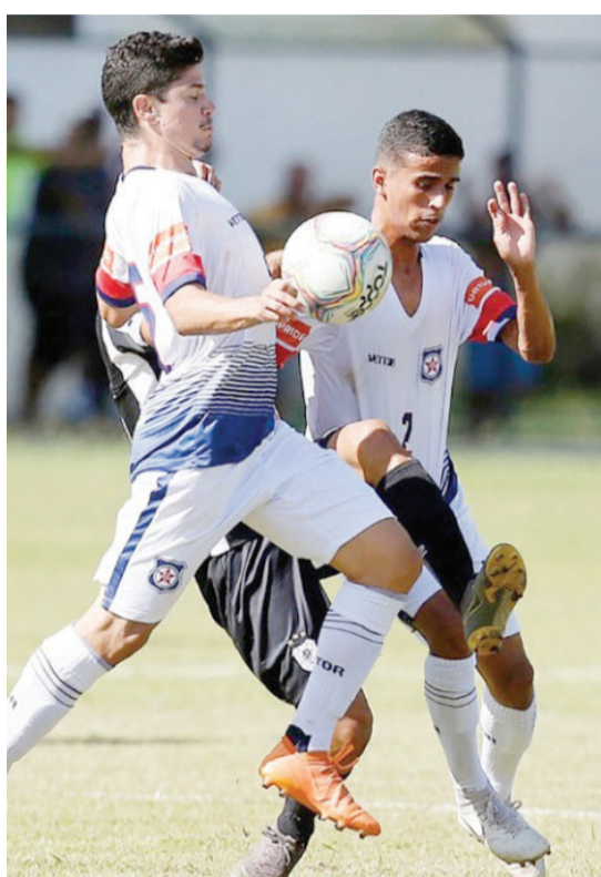
Tricolor consegue grande vitória e afasta qualquer risco de rebaixamento para a Série B1