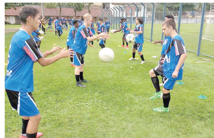
Equipe é montada com destaques das equipes e escolinhas do município

A equipe de Nova Friburgo pertence à competição no Centro-Norte fluminense, e a bola está prevista para rolar a partir de abril. A competição contará com a participação de dez ligas da região, e a presença friburguense é a novidade para 2020. Até o ano passado, Nova Friburgo integrava a competição na Região Serrana.