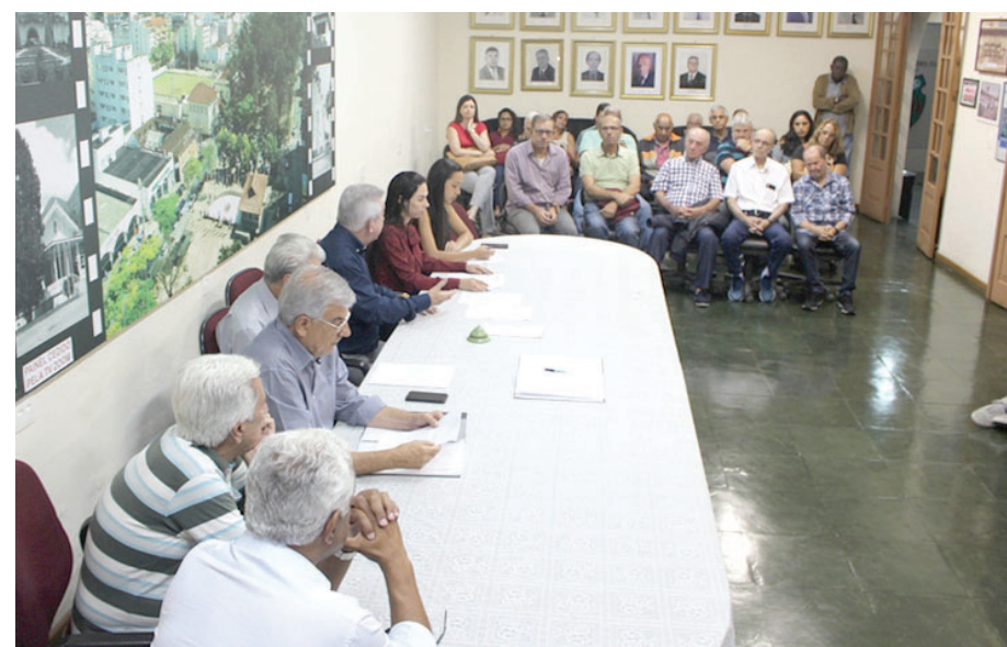
Reunião para prestação de contas do Nova Friburgo terá nova data marcada

A convocação era destinada para membros do Conselho Deliberativo do Nova Friburgo Futebol Clube. Posteriormente, uma nova data será marcada para a prestação de contas, procedimento este realizado anualmente pelo Conselho Diretor.