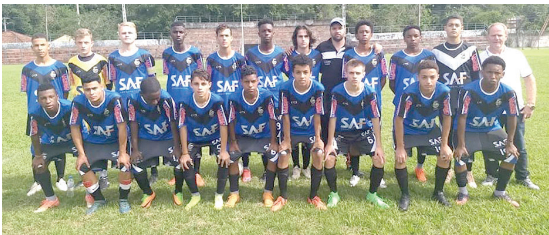
Nova Friburgo muda de região e vai tentar uma vaga na fase estadual de ligas

Os garotos de Nova Friburgo vão encarar uma missão complicada na primeira rodada do Campeonato Regional de Ligas Sub-17, promovido pela Federação de Futebol do Rio de Janeiro. Mantendo a tradição dos últimos anos, a Liga Nova Friburgo de Desportos confirma a presença da seleção municipal da categoria, e logo na estreia, o time friburguense vai encarar Duas Barras, atual campeã.