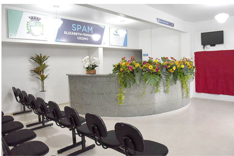
Com a reforma da unidade de saúde, a prefeitura espera oferecer mais comodidade e praticidade aos pacientes