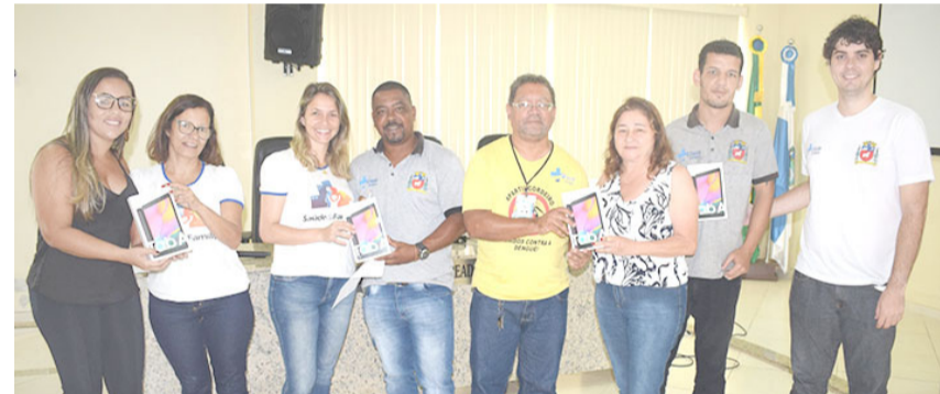
Profissionais de saúde recebem os tablets durante apresentação das propostas