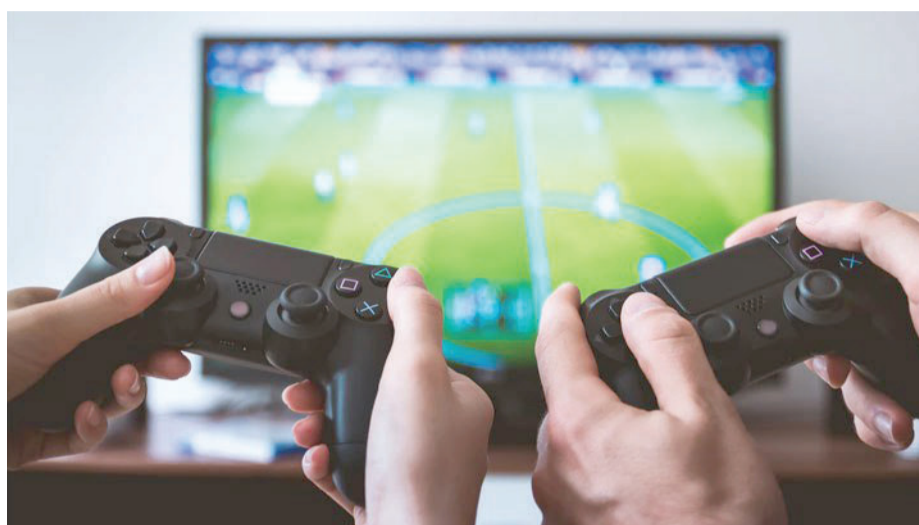
Crescimento dos jogos virtuais era tendência, e foi acelerada com pandemia