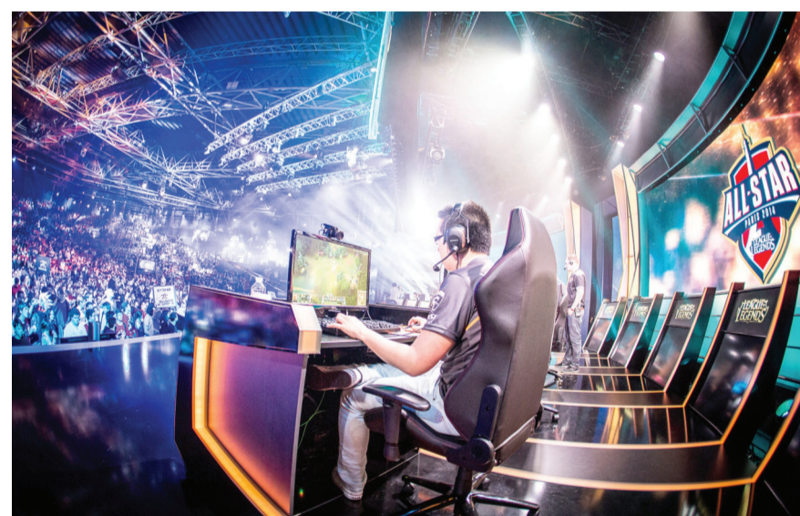
Em franco crescimento pelo mundo, E-sports atraem clubes diversos pelo país

Com potencial para alcançar diversas localidades, já há preparativos para abrir mais “sedes