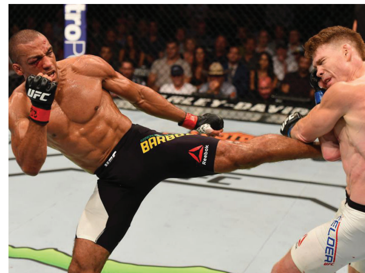
Retrospecto recente traz derrotas com decisões polêmicas: oportunidade para começar a reverter sequência

D e Nova Friburgo para o mundo, Edson Barboza já gravou o seu nome na história do UFC. Famoso pelas finalizações e chutes potentes, o friburguense tenta agora escrever novos capítulos em categoria diferente. Para tanto, já possui nova oportunidade encaminhada para a segunda luta pelo peso-pena (até 65,8 quilos). De acordo com órgãos de imprensa especializados em artes marciais, o Ultimate negocia para que Barboza encare o americano Jeremy Stephens no dia 3 de outubro, em local ainda a ser confirmado.