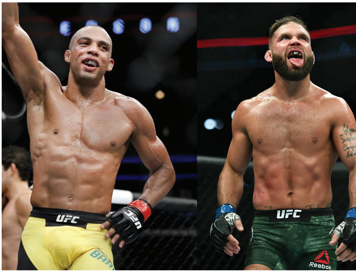
Barboza pode voltar ao octógono para enfrentar Stephens no mês de outubro