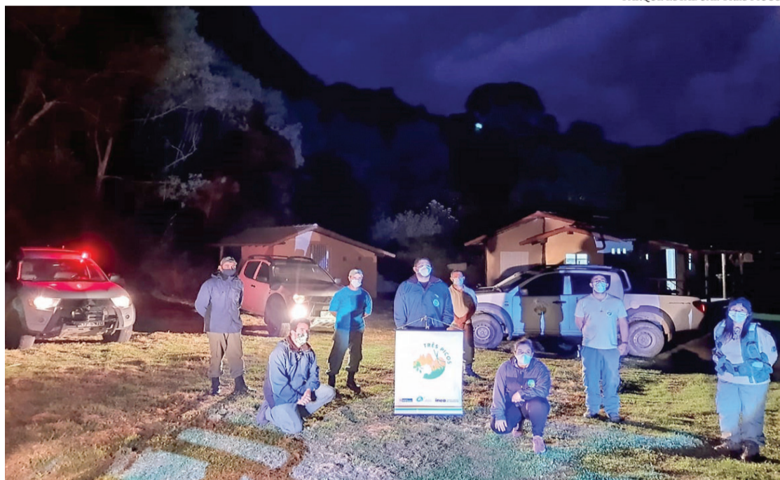
PARQUE ESTADUAL TRÊS PICOS

Após realizar uma operação conjunta para coibir a visitação ao Pico da Caledônia, em Nova Friburgo, que está proibida devido às medidas de prevenção e contenção da disseminação do coronavírus, conforme noticiado em primeira mão por A VOZ DA SERRA, o Parque Estadual dos Três Picos realizou novas ações durante todo o último fim de semana, desta vez na região dos Três Picos de Salinas. A operação contou ainda com apoio de guarda-parques do PEPT dos núcleos de Salinas, Jequitibá e Teresópolis, além da Polícia Militar e da 5ª Unidade de Polícia Ambiental Três Picos