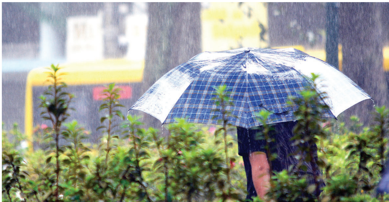
Os dias devem continuar chuvosos nos próximos dias em toda a Região Serrana

Um ciclone subtropical, associado à formação de uma Zona de Convergência do Atlântico Sul (ZCAS), é o que vem mantendo o tempo instável no Sudeste desde a semana passada e que frustrou muita gente que havia programado viajar para o litoral no feriadão da Proclamação da República. Em Nova Friburgo, segundo as previsões do site especializado em meteorologia Climatempo, o tempo só deve voltar a firmar no próximo