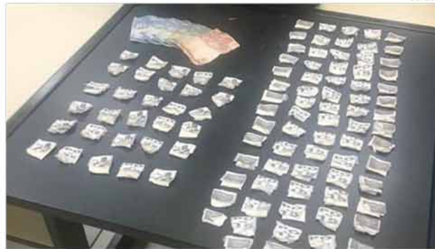
Toda a droga recolhida com a garota foi encaminhada para perícia na Polícia Civil

Os agentes avançaram em direção ao grupo que logo atirou. Os policiais revidaram, dando início ao tiroteio. O bando fugiu por uma mata, mas uma adolescente, de 15 anos, que estava escondida atrás de um galinheiro foi apreendida com uma sacola plástica que continha 103 sacolés de cocaína. Os entorpe-