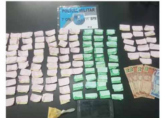
As drogas já estavam embaladas e prontas para revenda no distrito

Adolescente suspeito de vender cocaína também foi apreendido pela P2